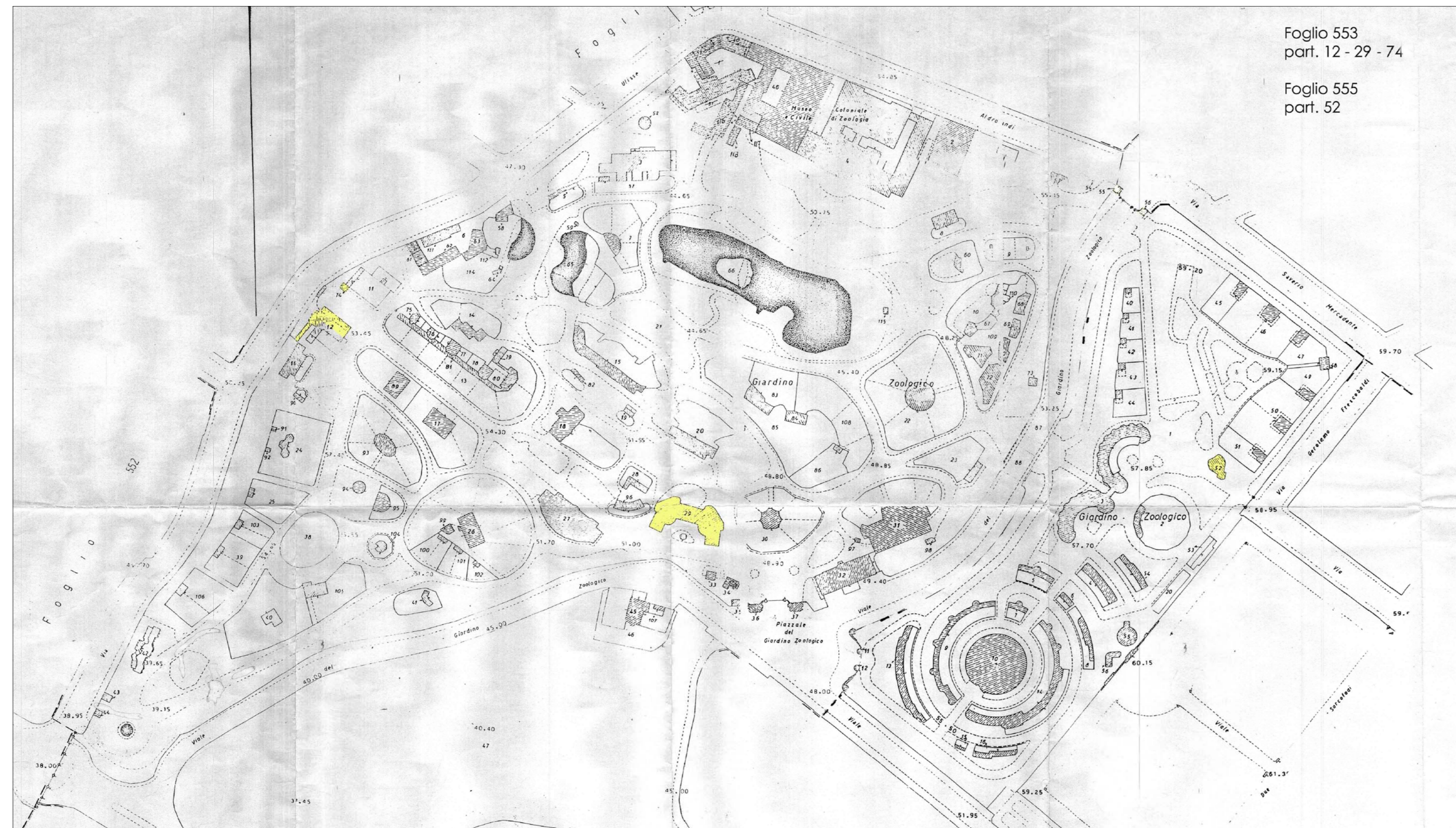
STRALCIO Planimetria Catastale - Fg.553 e 555

TUTTI I DIRITTI SONO RISERVATI - VIETATA LA RIPRODUZIONE NON AUTORIZZATA